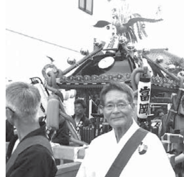
▲ 6月の浦安三社例大祭の宵宮で、富岡の御神輿の先導を仰せつかる