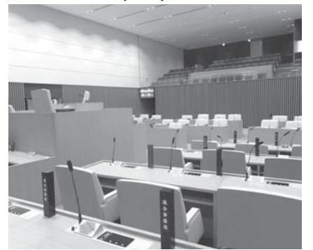
▲新しい議場はややコンパクトで、傍聴席との距離が近づいた印象があります。

う立地から、市民ニーズに合致した施設となるよう開館時間と休館日に関して質疑。開館時間は市民プラザより1時間遅い22時までとすること、休館日を他施設とずらす工夫がなされるとのことです。オープンは楽しみですね。