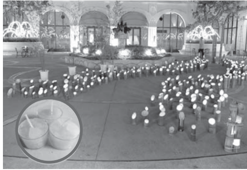
▲ ホテルオークラは、国内で初のエコマークを取得したリゾートホテル。環境保全に積極的に取り組んでいる

一年前、施設内で手作りするキャンドルの原料不足と販路に困っていた「きらりあ」と、エコ活動の一環としてライトダウンをイベントで行っているホテルオークラの縁を取り持つことができました。その時の約束通り、今年の「クールアースデー・ライトダウン」(天の川キャンドルアート)にきらりああキャンドルが採用され、エントランスを飾りました。